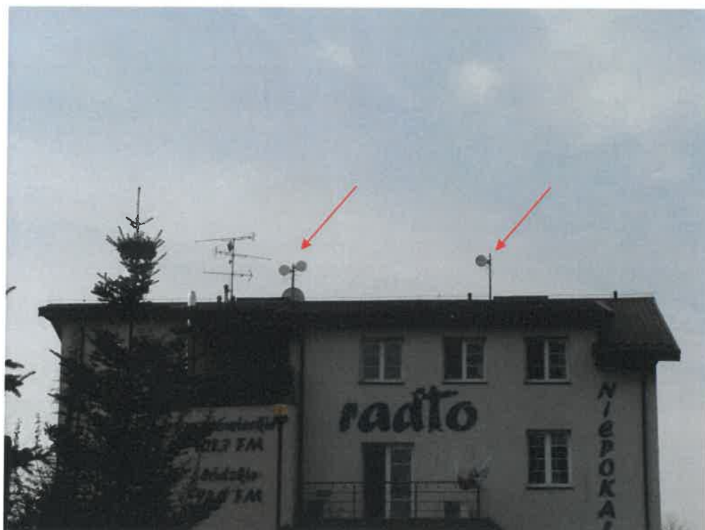
Widok instalacji radiokomunikacyjnej Stacja Netia TERNB005 - TERNM00003 Paprotnia, ul. Spacerowa 17.